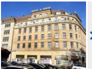
Französisches Unternehmen kauft Leipziger Hotel Astoria