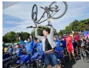
Neuer Rekord beim LVZ-Fahrradfest: 7600 Teilnehmer treten in die