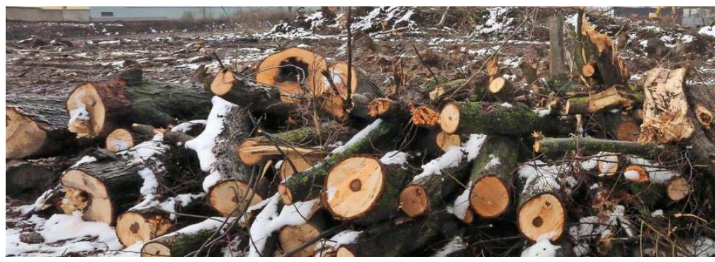
Auf dem ehemaligen Gelände des SK Bar Kochba standen zuletzt jede Menge Bäume.

| Artikel veröffentlicht: 03. März 2016 11:09 Uhr | Artikel aktualisiert: 03. März 2016 11:41 Uhr