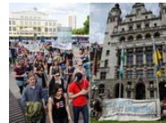
Hunderte demonstrieren in der City gegen Entmietung und Homophobie