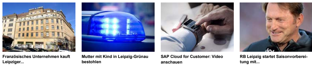
Fransösisches Unternehmen kauft Leipziger... Mutter mit Kind in Leipzig-Grünau bestohlen SAP Cloud for Customer: Video anschauen RB Leipzig startet Saisonvorbereitung mit...